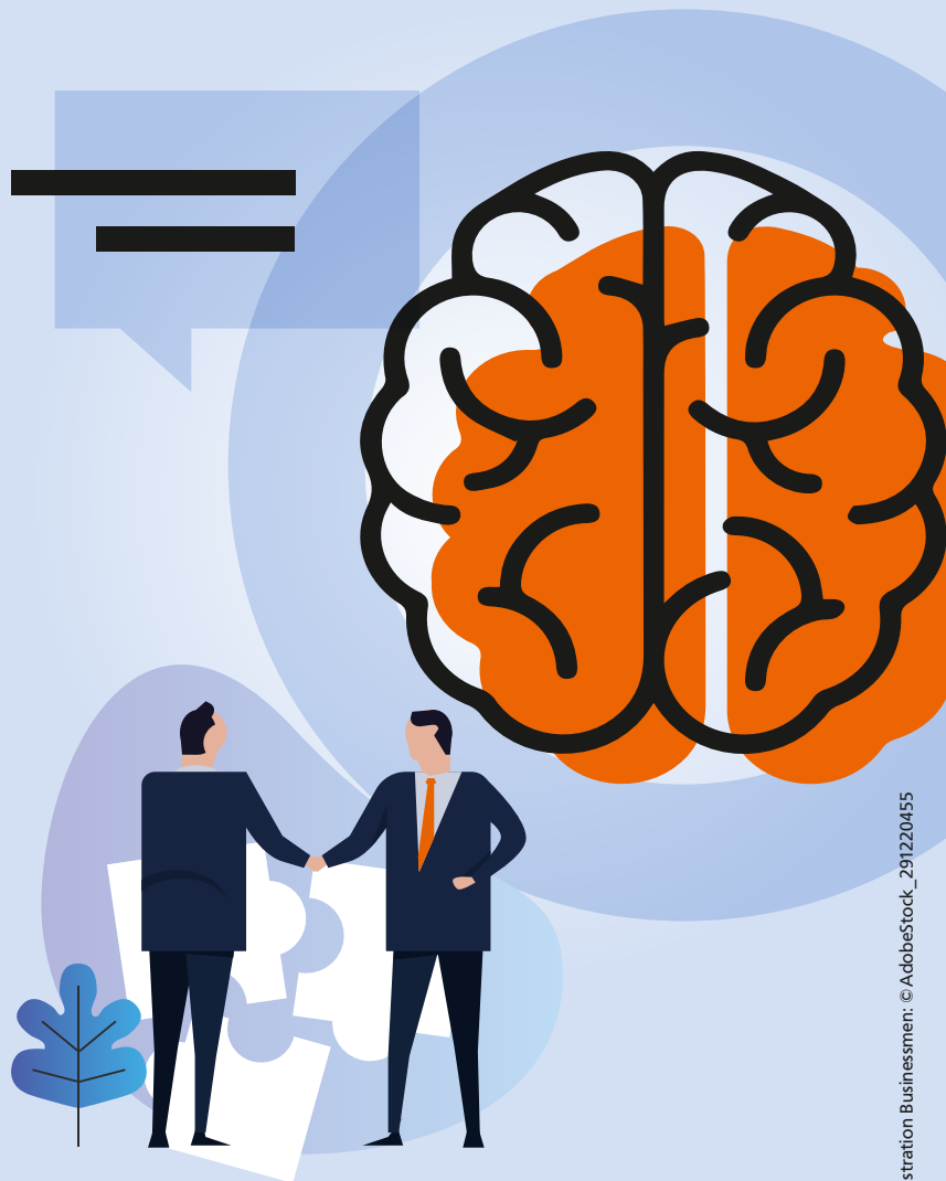
Illustration Businessmen